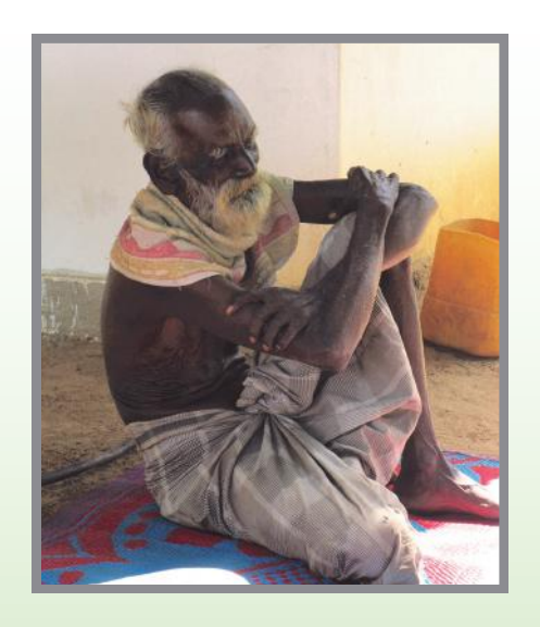
Above: Batticalo Below: Vadakkampirai