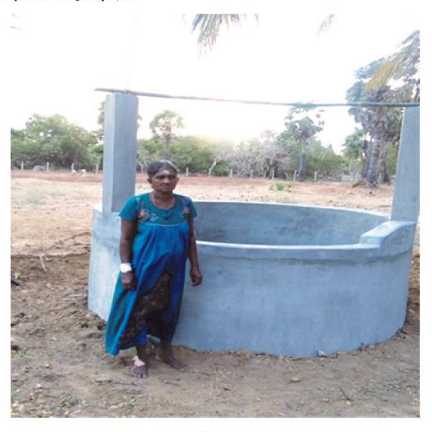
(2019 ஒரு பாளையால் செய்யப்பட்ட கிணறு)

எம் வடபகுதி மக்களுக்குக் கிணறுகள் தேவைதானா? என்பதை வார்த்தைகளில் விளக்கி விட முடியாது. ஏனெனில் உணர்வுகளை எழுத எந்த மொழிகளாலும் முடிவதில்லை. நீர் என்பது இந்த மக்களின் தேவையில்லை, அது அவர்களின் ஏக்கம், தவம், வாழ்வாதாரம்.